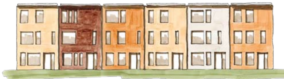
Voornamen gevelwand met woningen van drie lagen hoog

Verder konden de mensen kiezen uit vier soorten stenen en twee dakrandvarianten. Aan de buitenkant waren er dus wat regels, maar de indeling was vrij. De plattegrond heeft iedere koper met