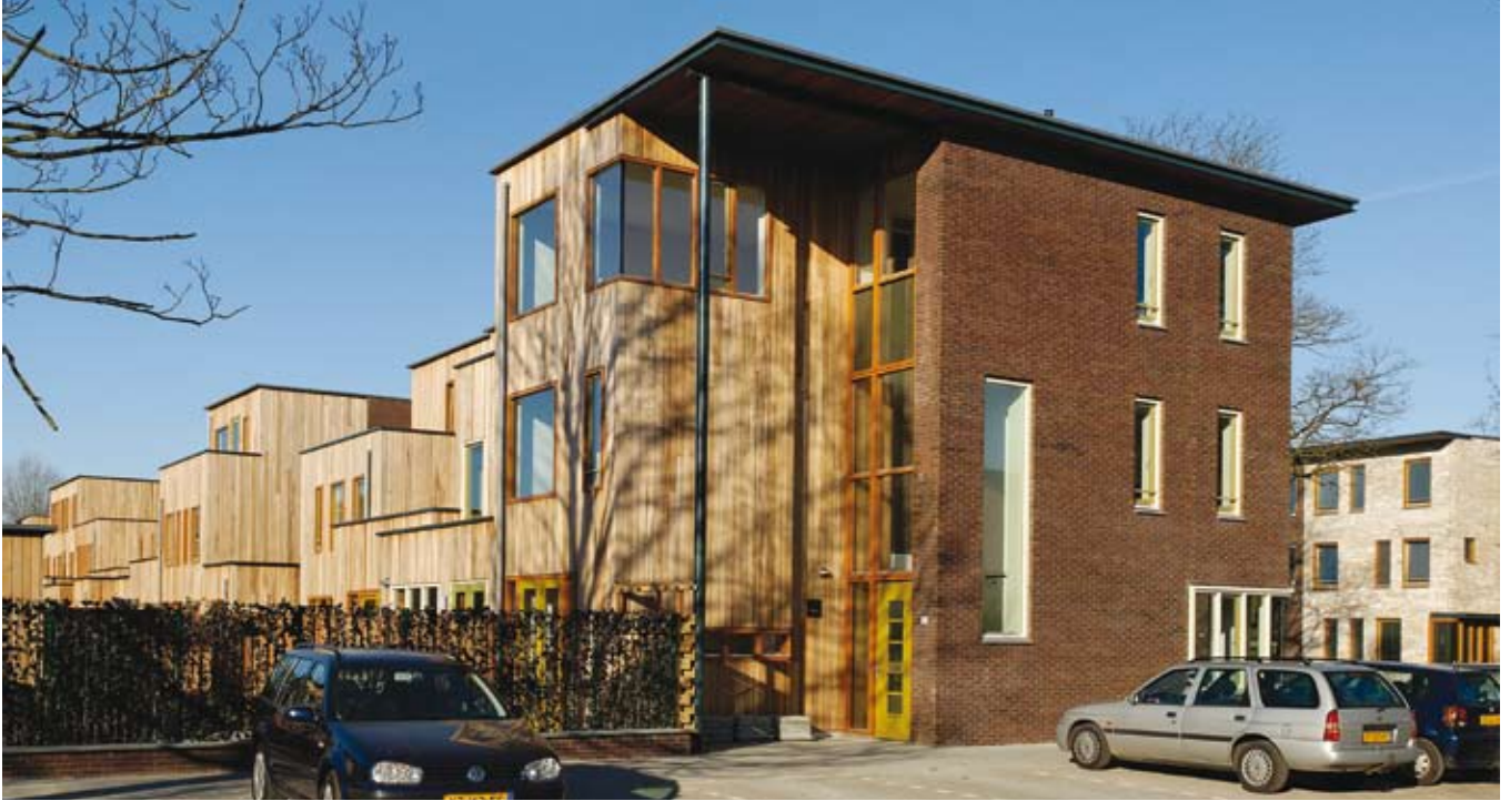
De achterzijde is van hout, en kan ook later worden uitgebreid