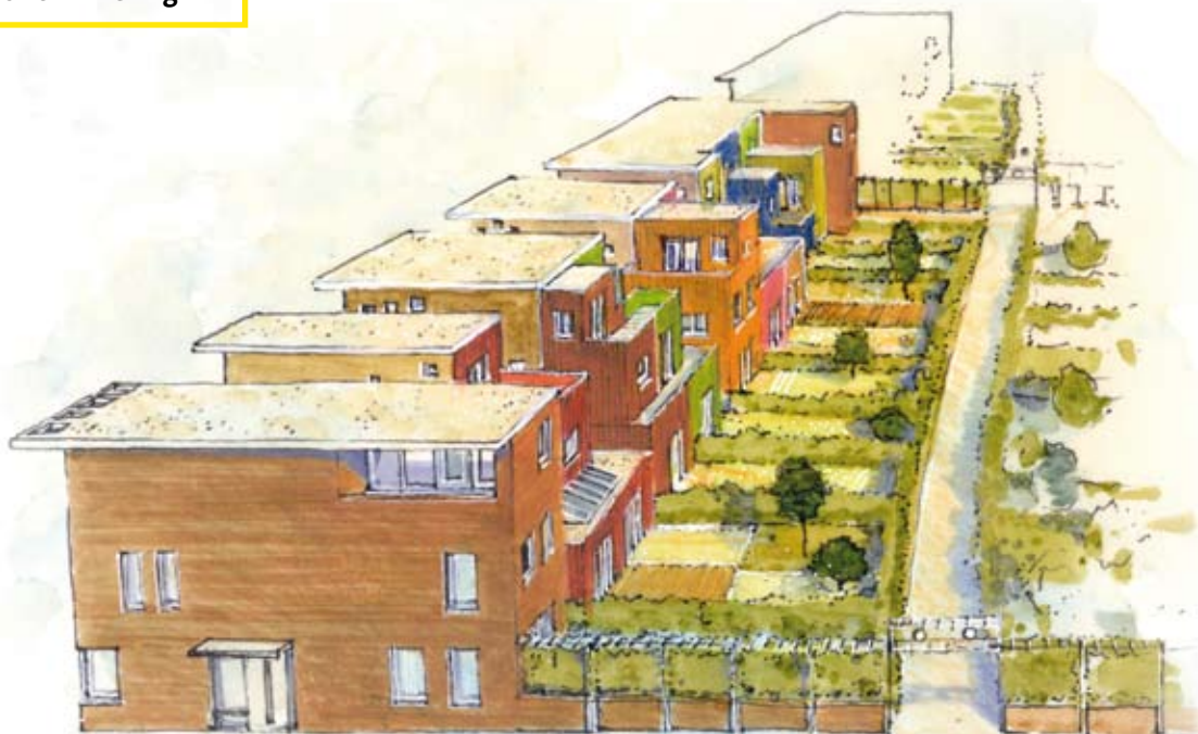
Bereikbare basiswoning heeft minder diepe etages en mogelijkheid voor volume uitbreidingen aan de achterzijde

ticuliere opdrachtgevers hun koopaannameovereenkomst pas in 2006 getekend, toen er ook al projectmatige woningen waren verkocht.