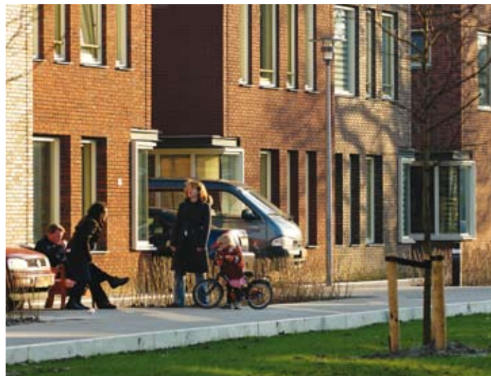
In het midden is een groene binnenruimte met plaats voor parkeren en spelen

voor een drumcabine. Hier konden wij de indeling helemaal zelf maken. En dat in een buurt met veel groen, vlak bij het centrum. Het was wel lastig dat het zo lang duurde voordat wij wisten hoeveel het ging kosten. Daardoor zijn er gaandeweg veel mensen afgehaakt. Maar wij wilden niet opnieuw gaan zoeken. Het is een mooie plek. En wij hebben het helemaal op maat kunnen maken. Ik heb nog een extra sessie gehad met de architect, maar dat kostte maar een klein bedragje extra. Voor mijn gevoel heeft het langer dan drie jaar geduurd, maar dat komt waarschijnlijk doordat wij steeds een andere opleverdatum