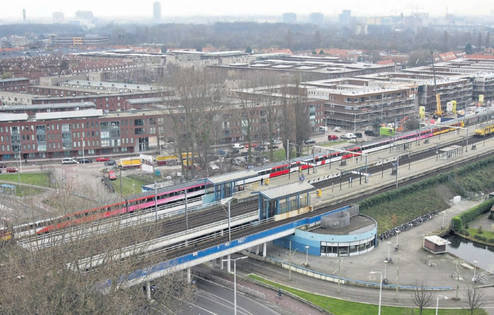
de 21ste eeuw.