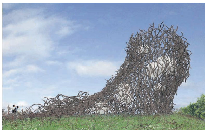
Artist's impression van Hidden Lives Tower.

Tegelijkertijd nam de architect maatregelen om de huizen in de woonwand comfortabel te maken. Zo werden de woningen op de begane grond op een plint gezet, waardoor ze afstand krijgen tot de straat. Woonkamers situeerde hij aan de achterkant van het complex, zodat de bewoners uitkijken op een tuin. Een geluidsscherm langs het spoor zorgt voor een laag geluidsniveau. Op de volgende etages liggen zowel